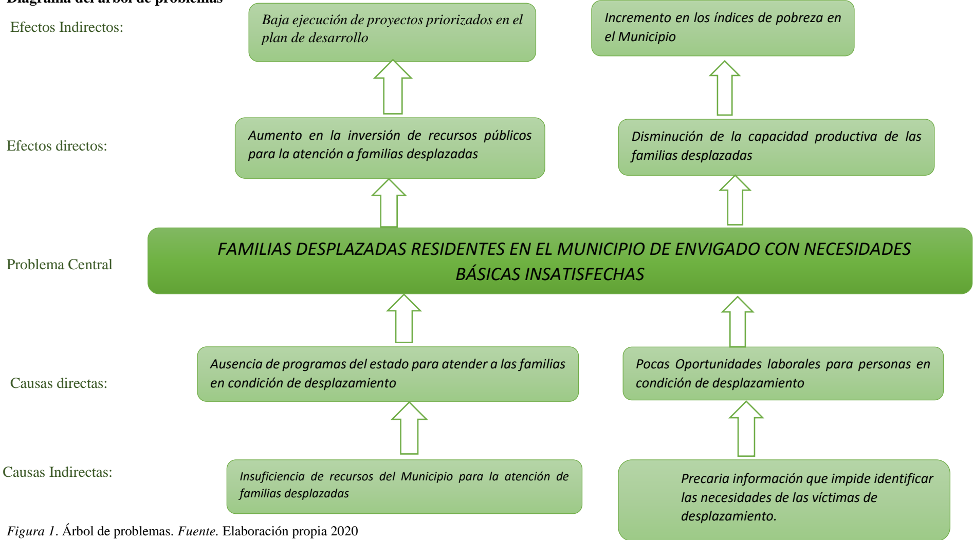
Figura 1. Árbol de problemas.