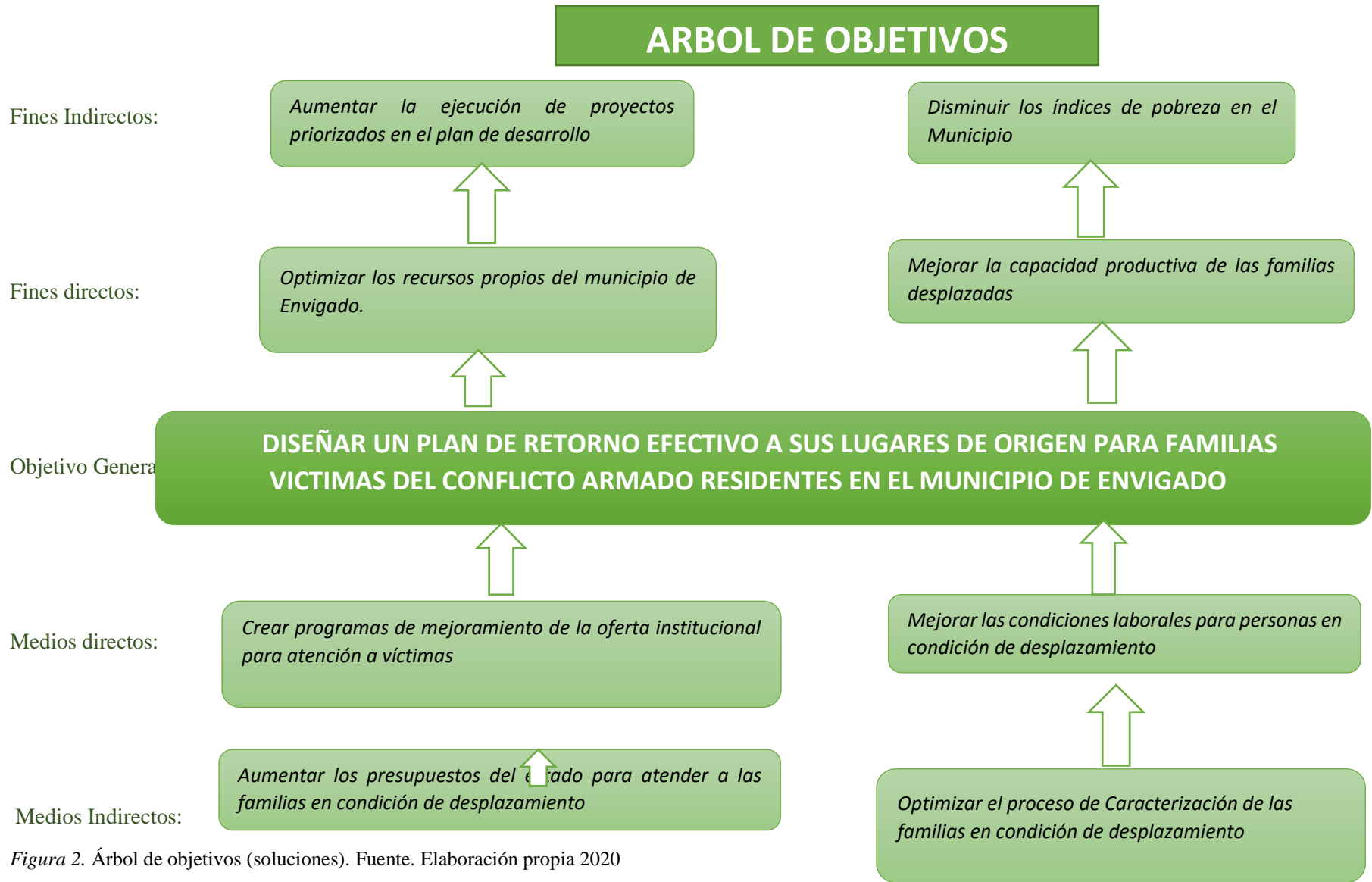
Figura 2. Árbol de objetivos (soluciones).