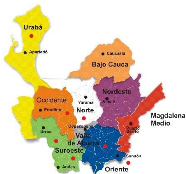
Figura 4. Mapa de Antioquia.

El problema central del presente proyecto se identifica en el Municipio de Envigado, quién se convierte en receptor al recibir en su territorio familias víctimas del desplazamiento de otros municipios del departamento de Antioquia.