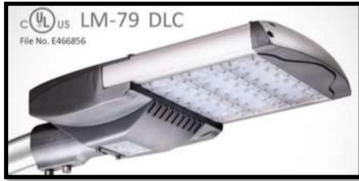
Figura 3. Fotografía de las luminarias a utilizar en la instalación del proyecto