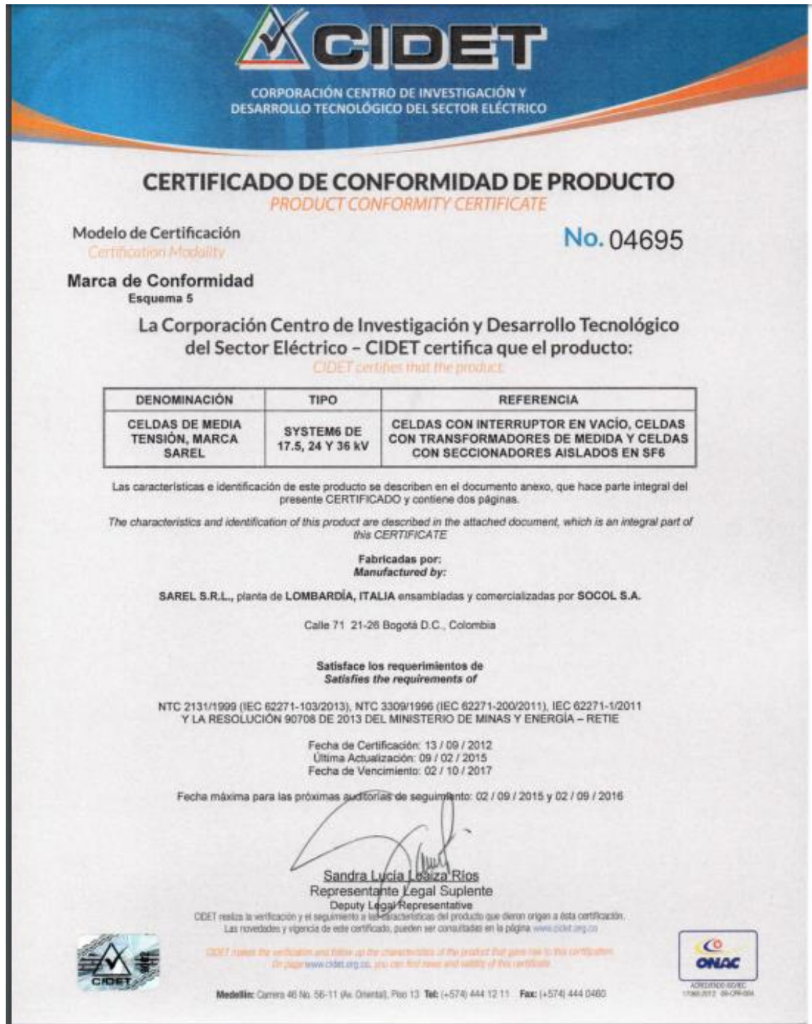
Anexo 1 Certificado de conformidad de Producto