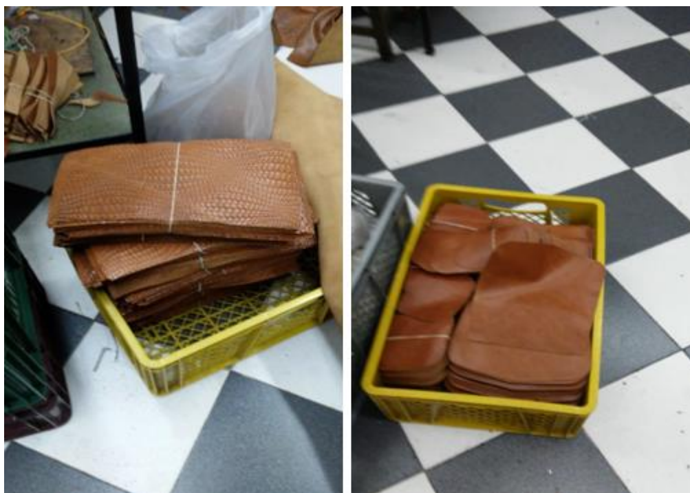
Imagen 3. Materia prima cortada