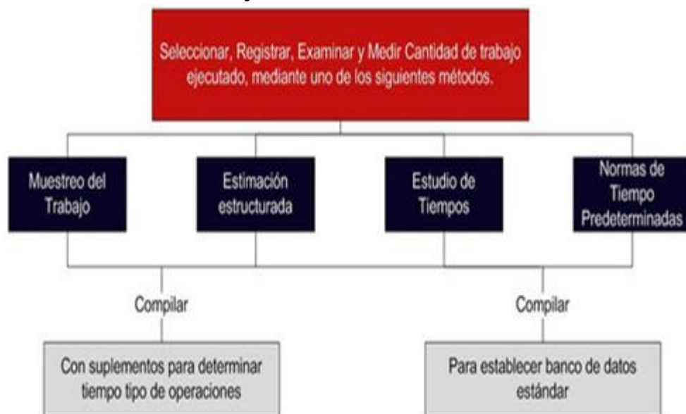
Imagen 4. Medición de trabajo