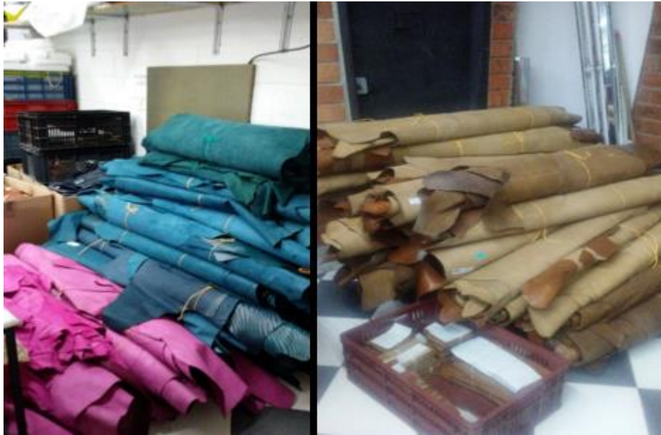
Imagen 1. Materia prima en altas cantidades que superan la capacidad de planta.