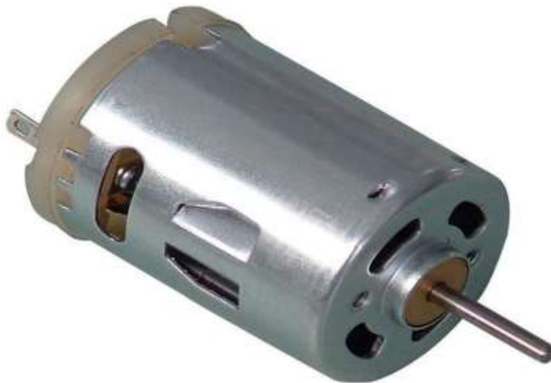
Figura 4: Motor DC 12V, 30 Watos

Para sensar el inicio y fin de corte, se dispondrá de sensores ópticos o fines de carrera que entregarán la señal digital al control programable, para comandar el movimiento.