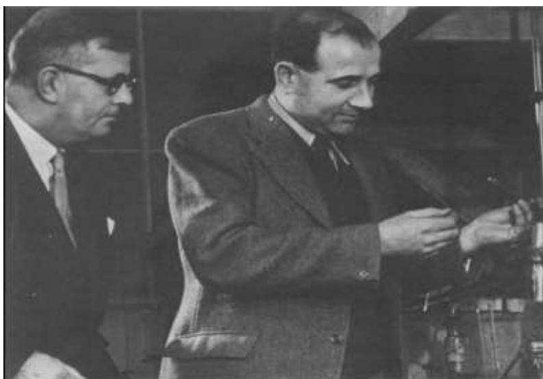
Figura 5: Recauda PET

sofisticación, fundamentado en el impresionante aumento del producto a escala global y la ampliación de sus opciones. Desde 1976, se emplea en la producción de recipientes livianos, transparentes y duraderos, principalmente destinados a bebidas. No obstante, el PET ha experimentado un avance notable en el sector de los empaques. En México, se inició su uso para este propósito a mediados de la década de los ochenta. RecaudaPET.(2013, 30 de noviembre)