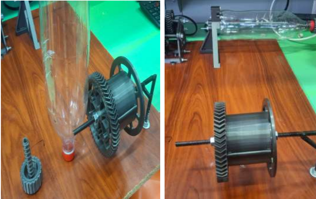
Figura 7: Sistemas de tracción y guía de botella