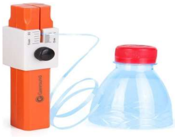
Figura 1: Cortadora de botella PET

El cortador de cuerda de botellas de plástico proporciona una manera fácil de ayudarlo a tratar cualquier tipo y forma de botellas de plástico, como botellas de cola, jugo, agua de soda haciéndolas en cuerda de plástico.