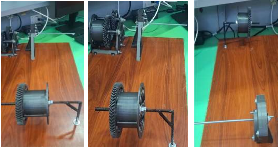
Figura 6: Cortadora y sistema de tracción

Evaluar viabilidad comercial: Asegurarse de que el producto cumpla con estándares de calidad para aumentar su competitividad en el mercado.