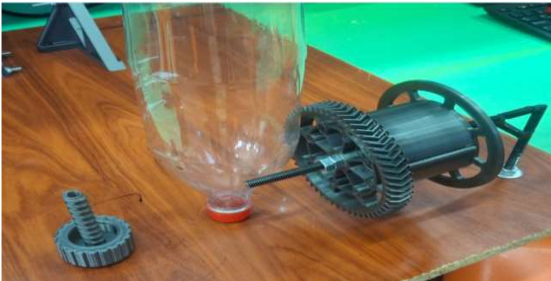
Figura 8: Guía de botella y de tracción